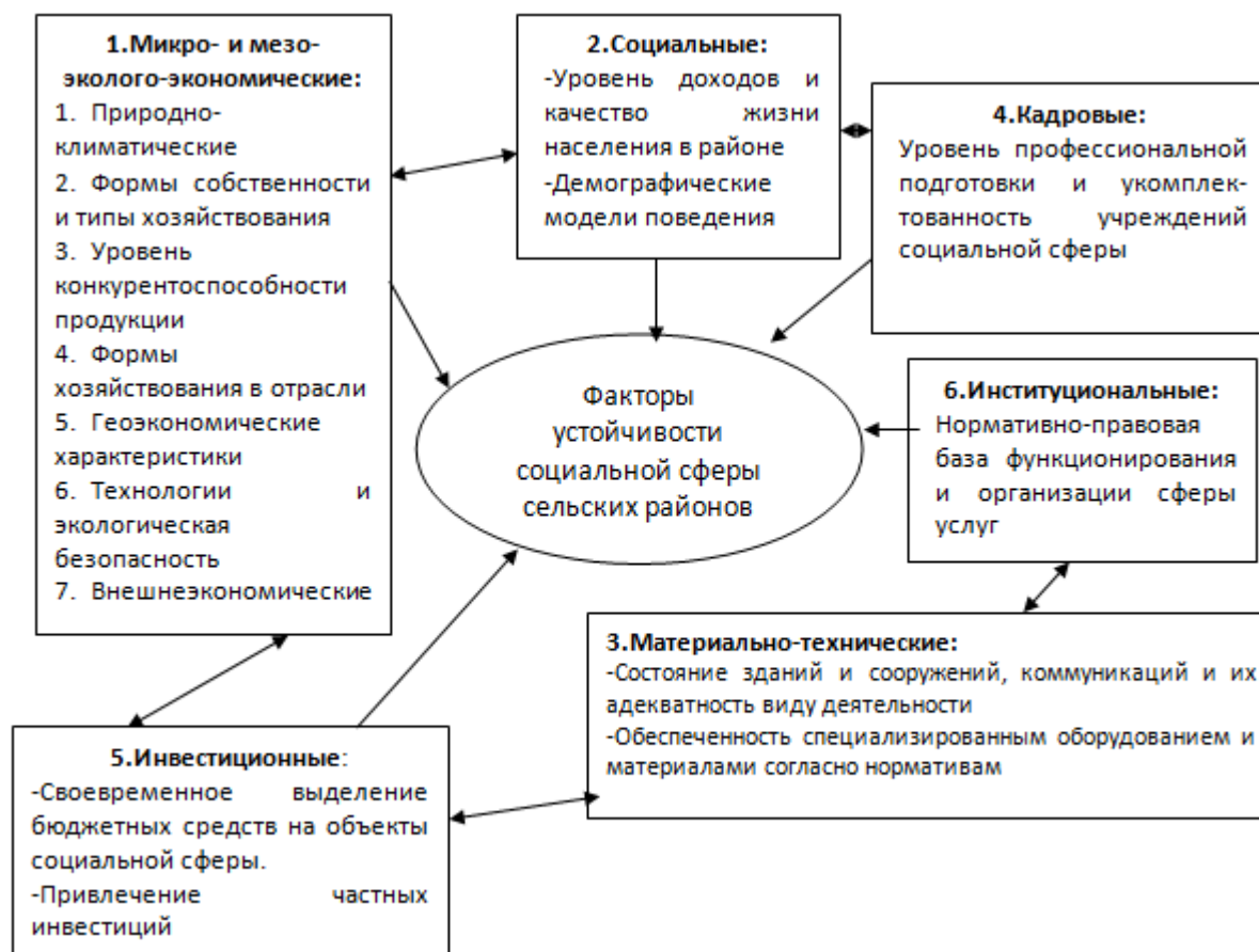
Рис. 3. Факторы устойчивости социальной сферы сельских районов