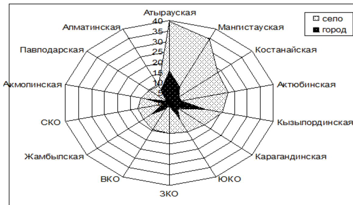
Рис. 2. Доля бедных в городских и сельских районах Республики Казахстан в 2015 году (%).

Согласно исследованиям автора статьи к элементам социальной структуры сельских территорий, предлагается относить отрасли: образование; здравоохранение; культуру и искусство; жилищно-коммунальное хозяйство; общественный транспорт и средства связи; бытовое обслуживание; торговое обслуживание; физкультура и спорт.