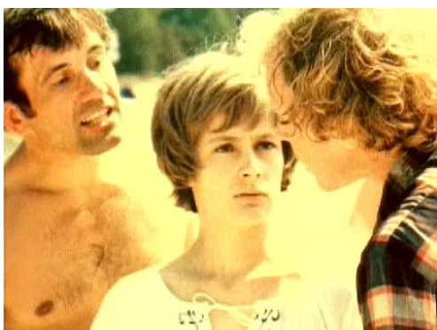
Рис. 3. Кадр из фильма «Кузнечик» (1979)