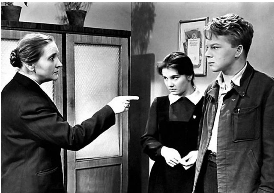
Рис. 3. Кадр из фильма «А если это любовь?» (1961)