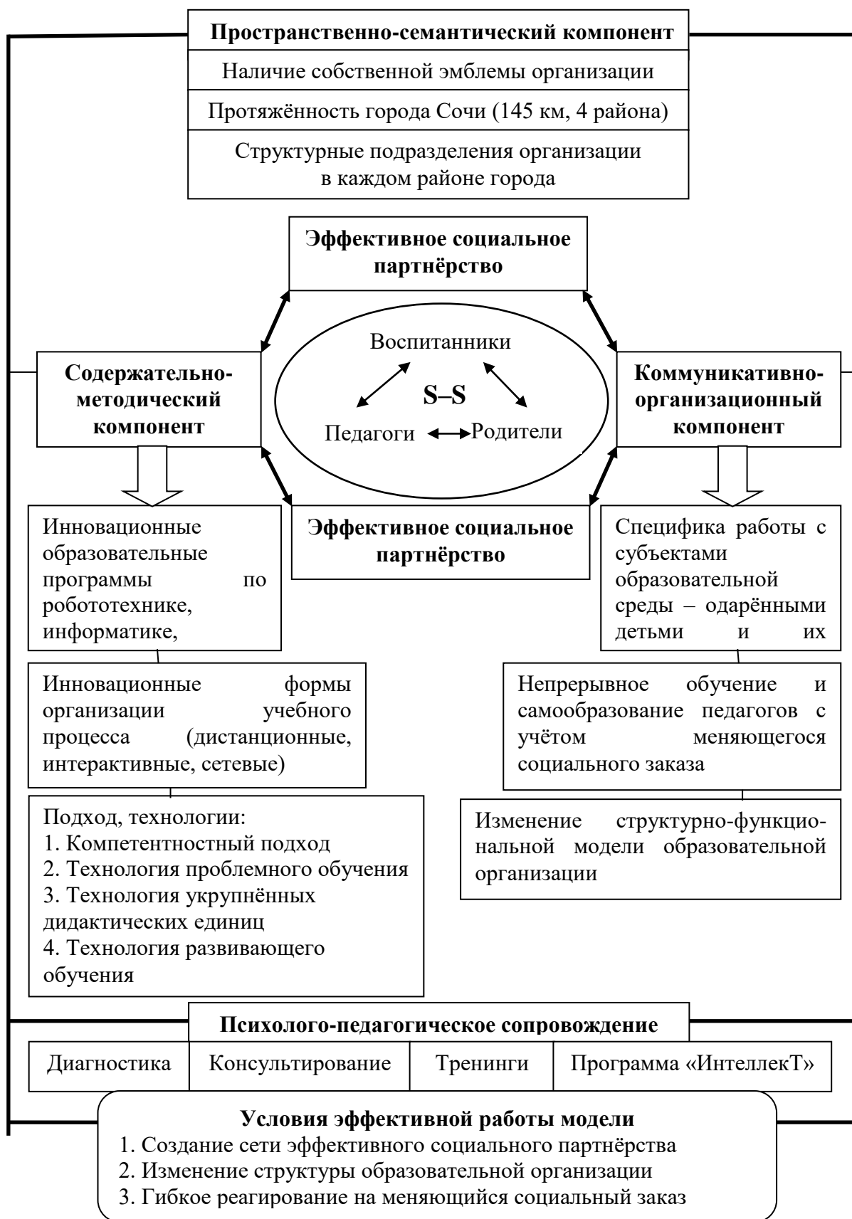
Рис. 1. Модель инновационной образовательной среды личностного развития и самореализации обучающихся с признаками одаренности в Центре творческого развития и гуманитарного образования