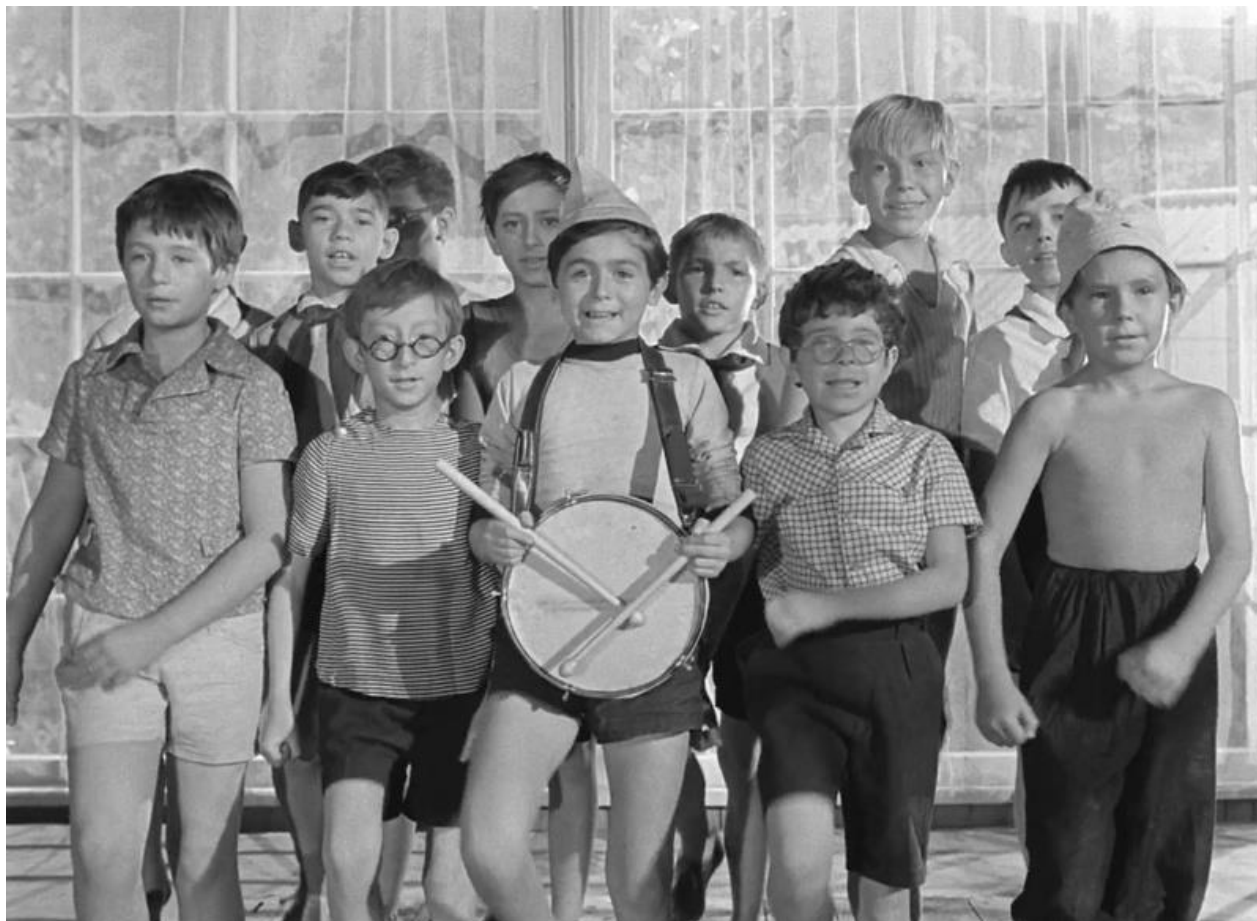
Рис. 2. Кадр из фильма «Добро пожаловать, или Посторонним вход воспрещен» (1964)