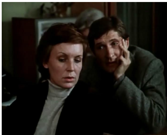
Рис. 6. Кадры из фильма «Кафедра» (1982)