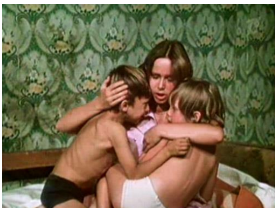
Рис. 4. Кадр из фильма «Контрольная по специальности» (1981)

Несмотря на снижение престижа высшего образования в эпоху «застоя» по разным причинам, в частности, из-за «уравниловки» в оплате квалифицированного и неквалифицированного труда, судя по советским фильмам на студенческую тему, у абитуриентов была достаточно высокая мотивация поступить в вуз, особенно у молодых