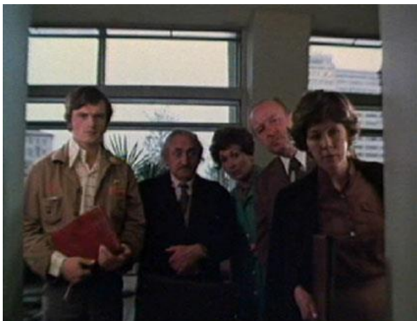
Рис. 5. Кадр из фильма «Баламут» (1978)

Кадры из фильмов эпохи «застоя» на студенческую тему, представленные ниже, отражают медиаобразы советских преподавателей вузов тех лет.