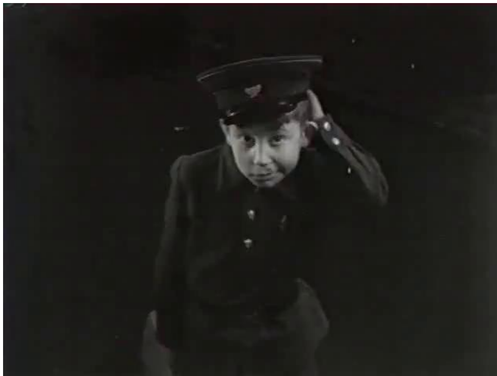
Рис. 4. Кадр из фильма «Три с половиной дня из жизни Ивана Семёнова, второклассника и второгодника» (1966)