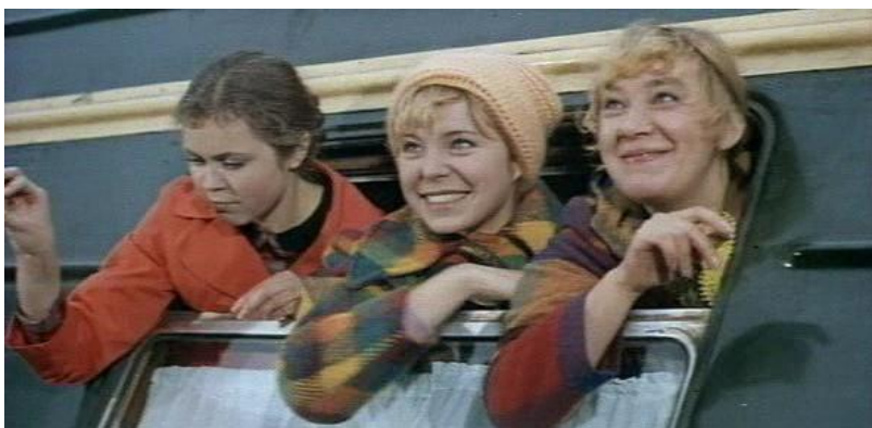
Рис. 1. Кадр из фильма «Это мы не проходили» (1975)

Кадр из фильма «Это мы не проходили» (1975), представленный ниже, отражает внешний вид, одежду, телосложение персонажей-студентов тех лет.