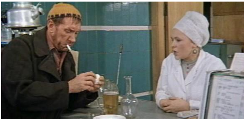
Рис. 2. Кадр из фильма «Это мы не проходили» (1975)