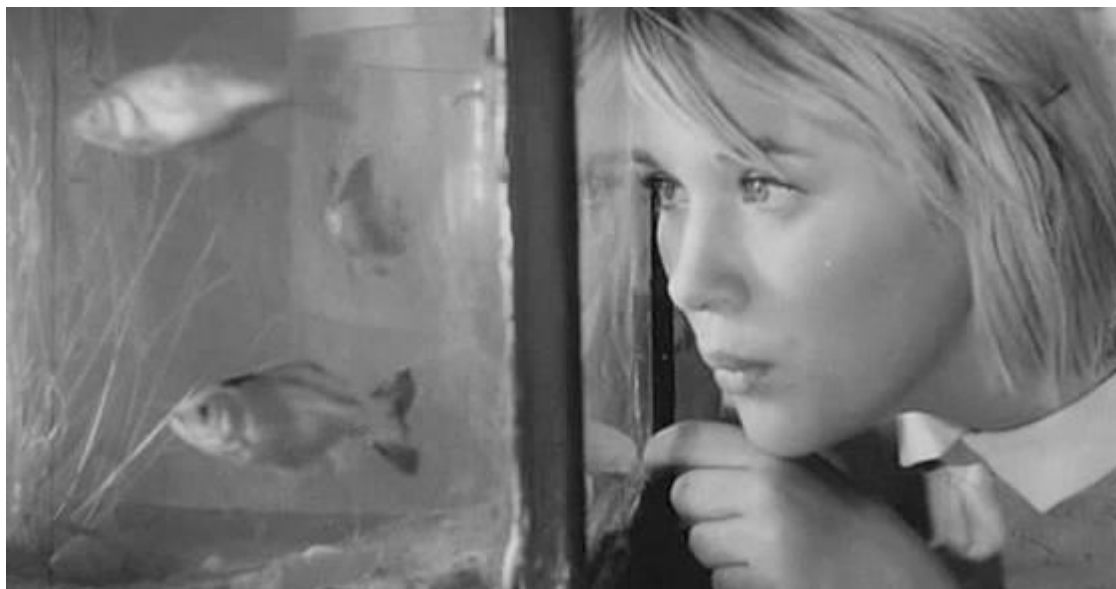
Рис. 1. Кадр из фильма «Дикая собака Динго», 1962

Инновационные процессы, происходящие в школе 1960-х нашли свое отражение в фильмах «Доживем до понедельника» (1968), «Переходный возраст» (1968) и др. Вместе с тем, в игровых фильмах школьной проблематики по-прежнему можно найти символы, свидетельствующие о правящей идеологии: пионерские галстуки и комсомольские значки, знамена в коридорах школы, красноречивые лозунги и призывы и т.д.