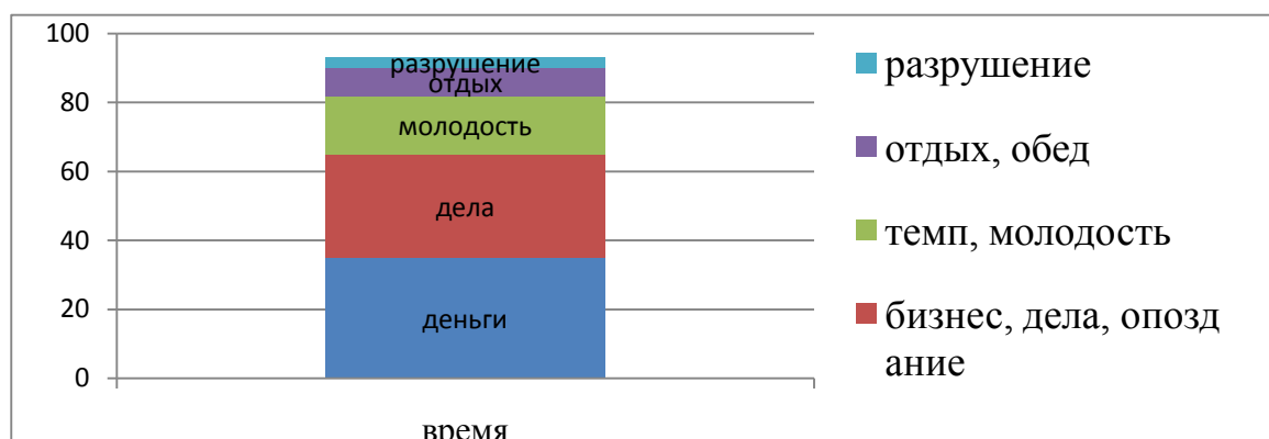
Рис. 2. Восприятие категории «время» в сознании респондентов мужского пола

Ассоциации мужского пола на слово-стимул «время» представлены в виде диаграммы №2.